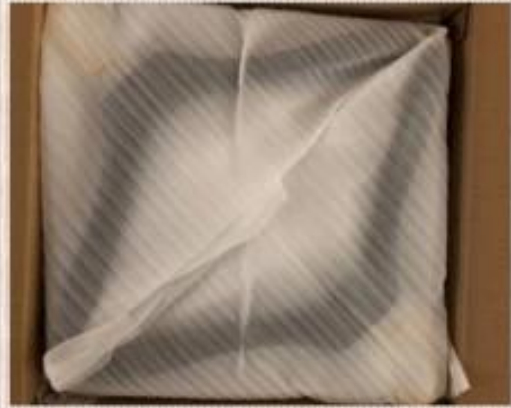
every hanger packed in one PE foam