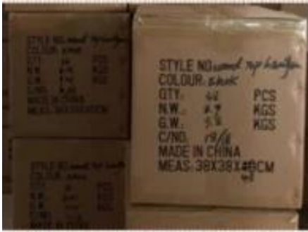
print Mark & details