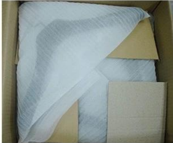
Place Layer by Layer