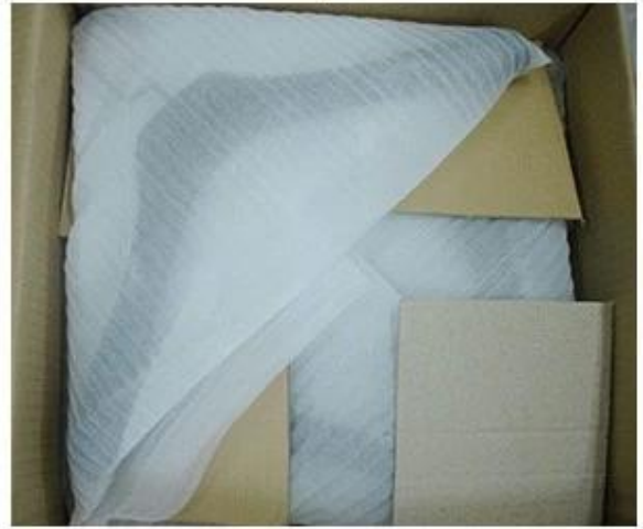
Place Layer by Layer