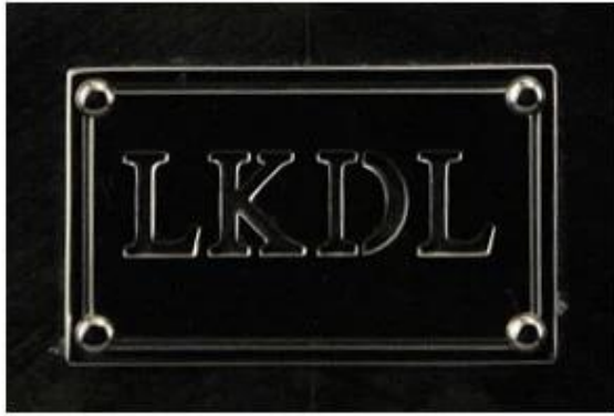
Metal plate logo