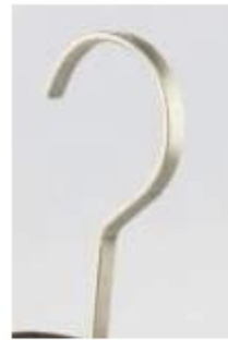
flat pearl nickel