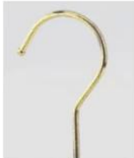
light gold with bulb