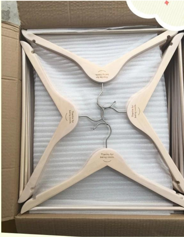
flat wooden hanger with cross-bar package