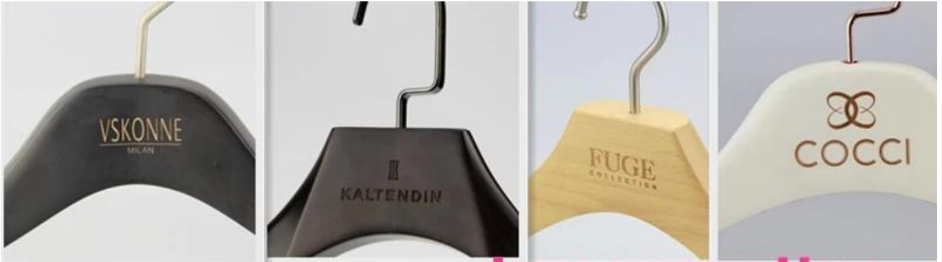
laser engraved logo