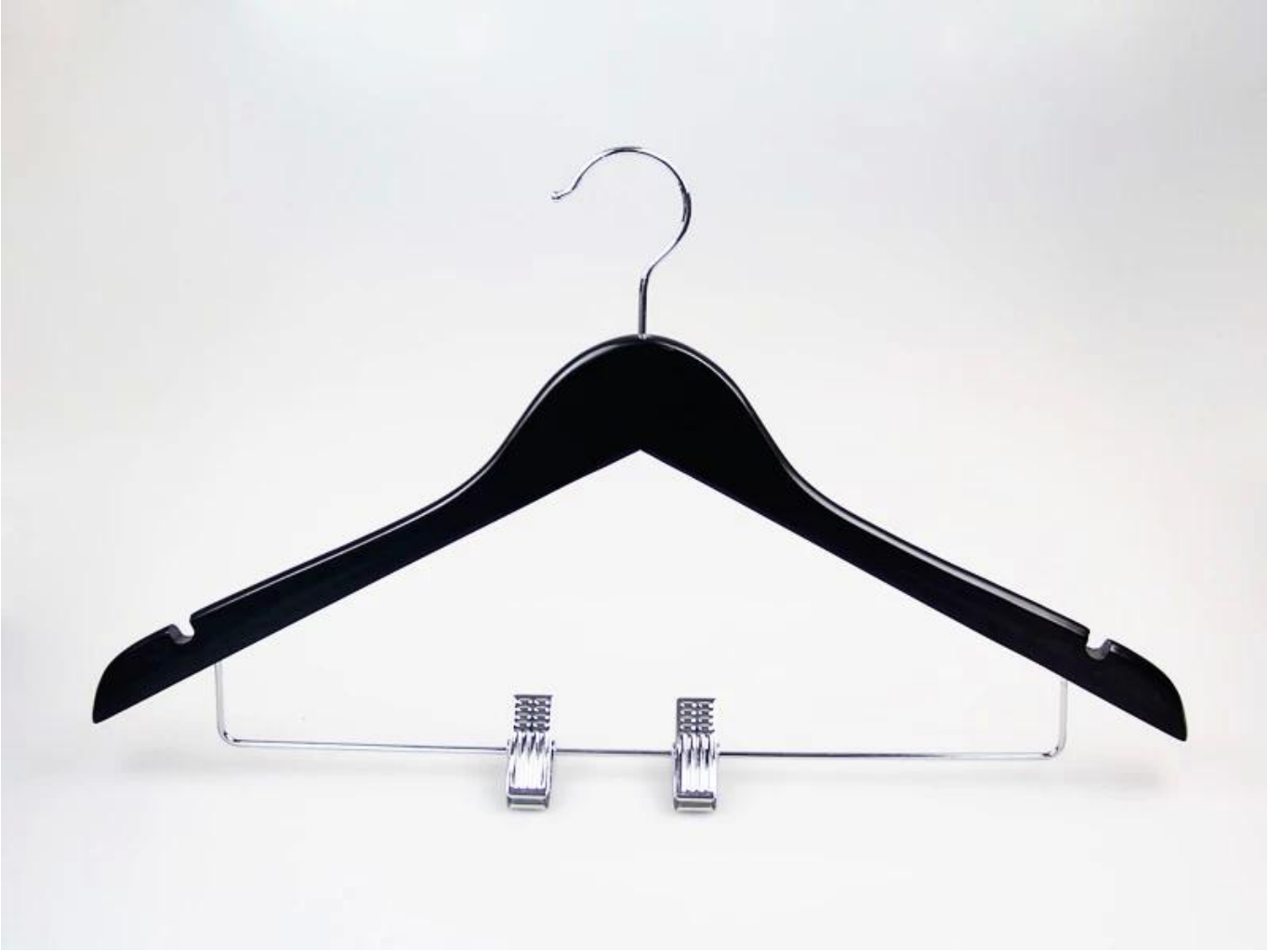
OEM مصنع شماغات خشبية