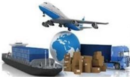
pallet load in container or spack in air craft.