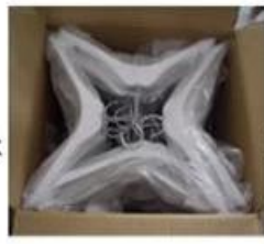
Put into a master carton