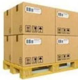
8 or more master carton load on wood or plastic pallet.