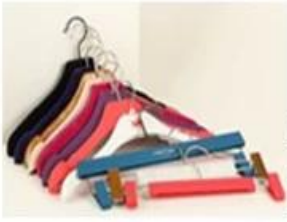
Each product pack with opp bag