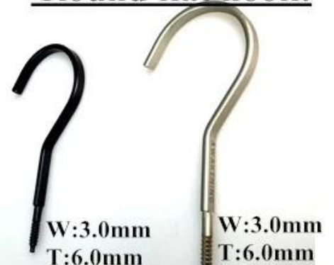
W:3.0mm T:6.0mm black