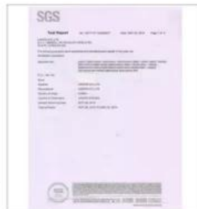
Product Test Report