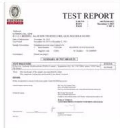
Product Test Report