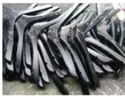
check the product to

spray paint again(hand paint more than 4 times)