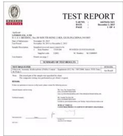
Product Test Report