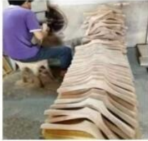
(Hand polishing more than 4 times)