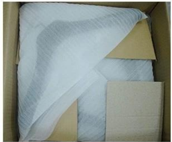
Place Layer by Layer