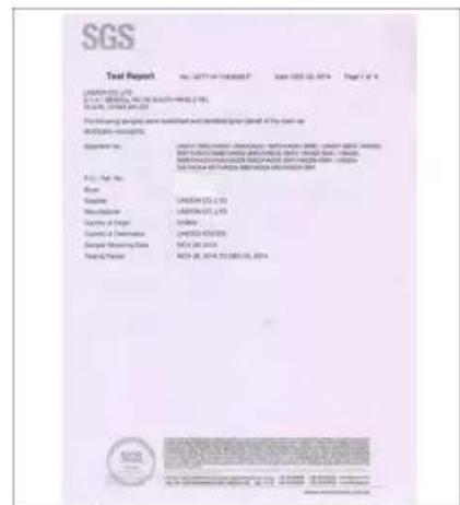
Product Test Report