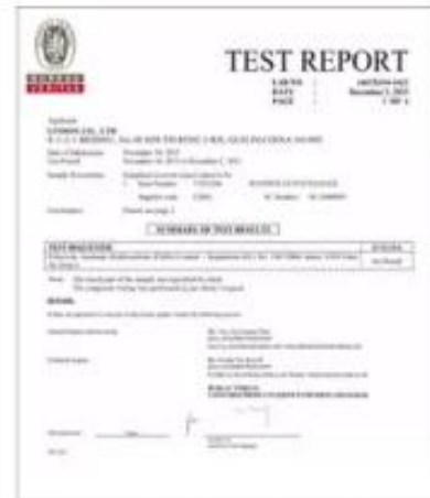
Product Test Report