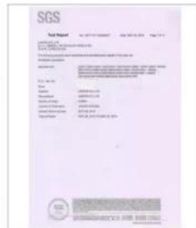
Product Test Report

Kontakt https://www.chinahangersupplier.com/products/Electro-plated-Plastic-Hanger.htm