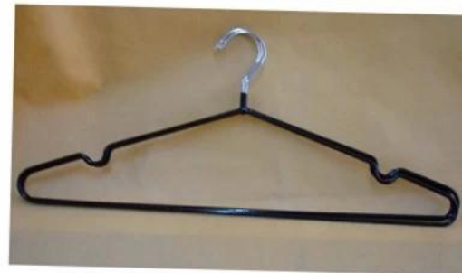
Hanger Model coated with black PVC surface