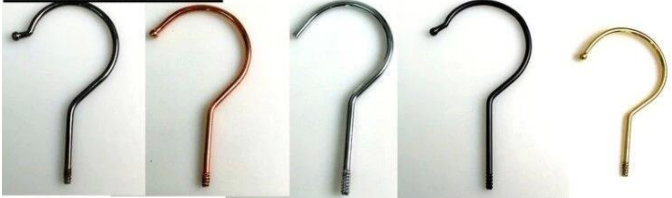
Dia: \varnothing 3.8mm gun black