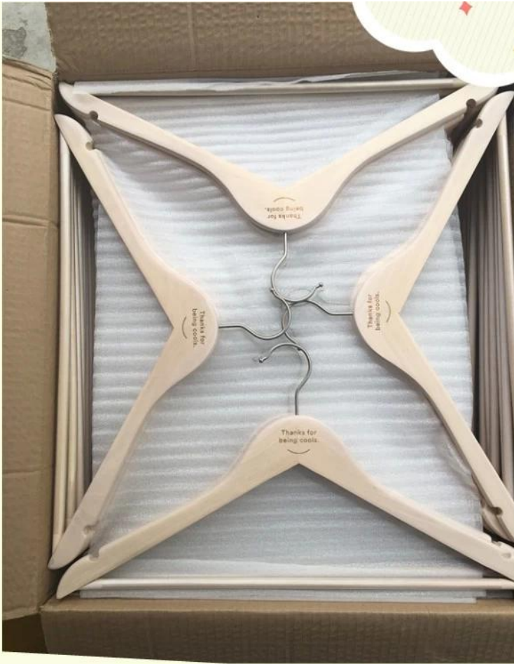
flat wooden hanger with cross-bar package