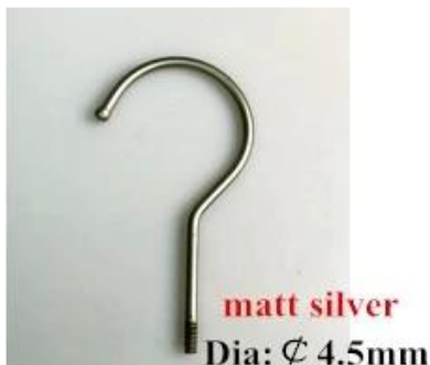
matt silver Dia: \varnothing 4.5mm