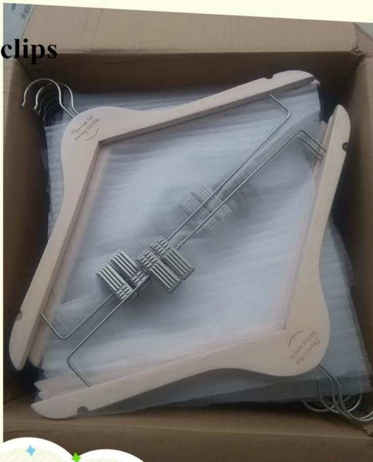
flat wooden hanger with clips package