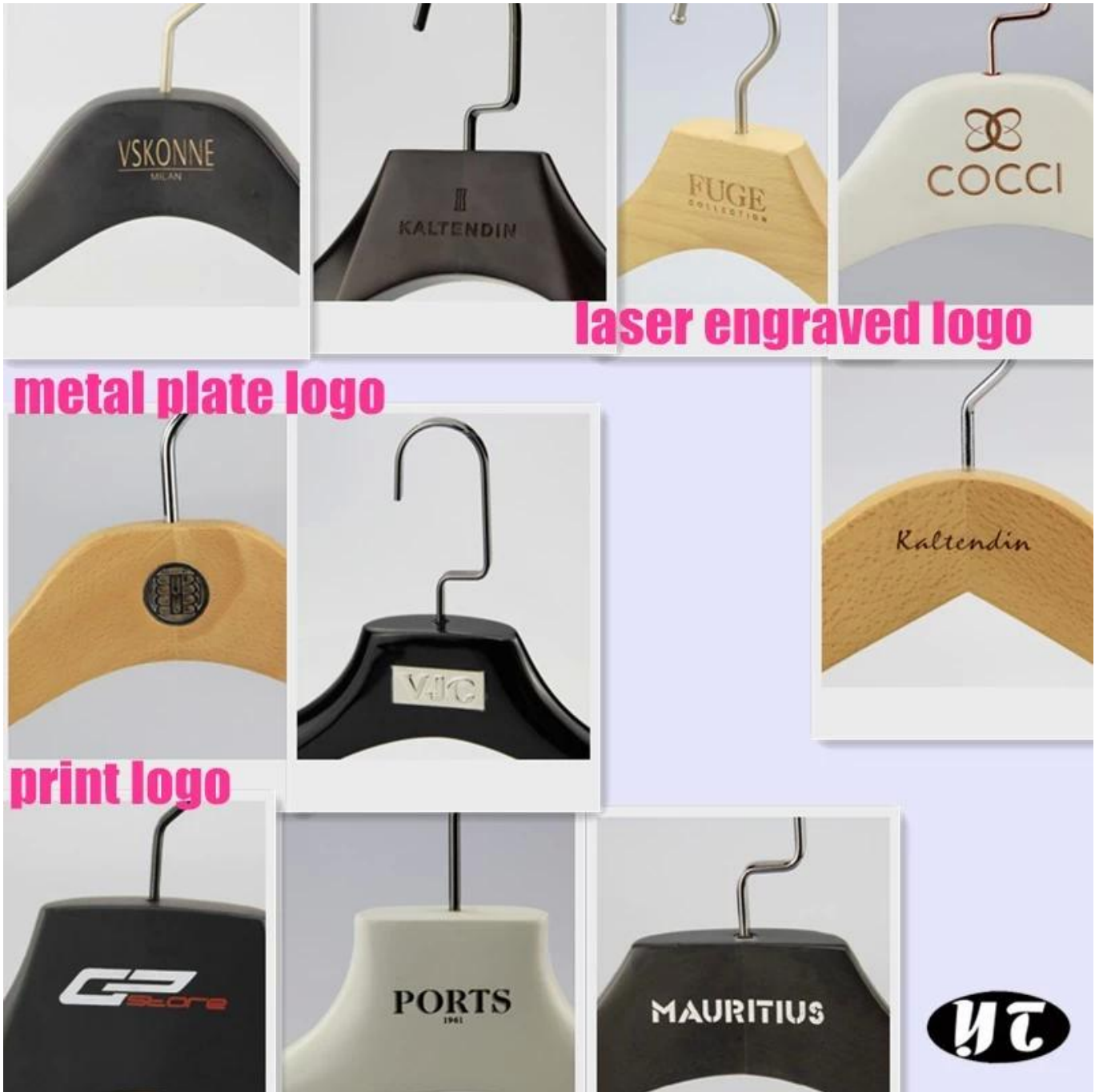
laser engraved logo