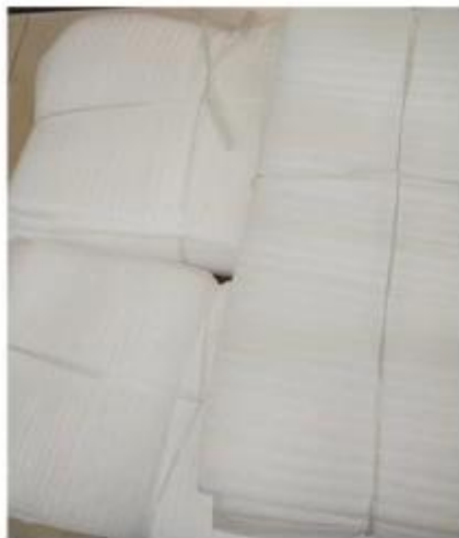
PE Foam Bag