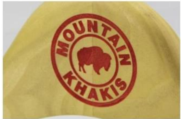
Laser logo in other color