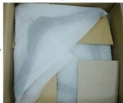
Place Layer by Layer

Wir Kunststoff-Aufhänger mit guter Qualität durchsichtigen Plastikbeutel verpacken, legen Sie in geeigneten benutzerdefinierten K = K Karton mit geeigneten Menge jeder Karton, die Box Gewicht tun nicht mehr als 15kgs. Print Versand Mark außerhalb jeder