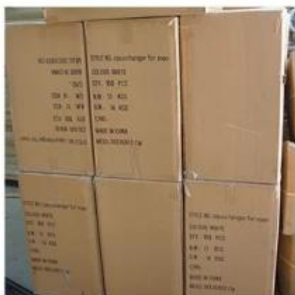
K=K Carton with Shipping Mark