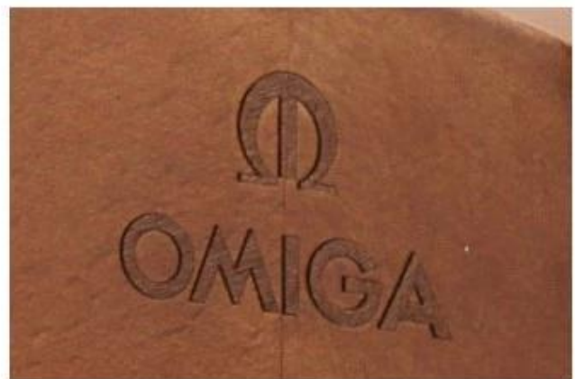
Laser logo before paint