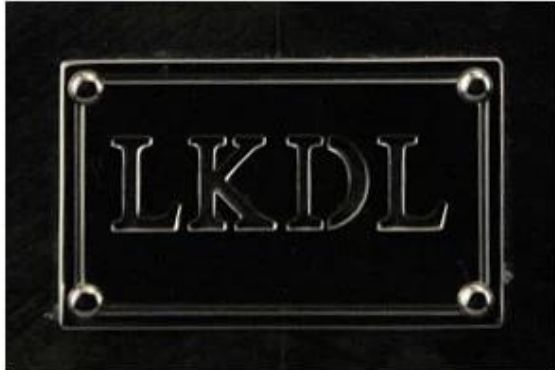
Metal plate logo