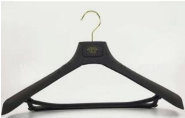
43cm*6.8cm- rubber paint