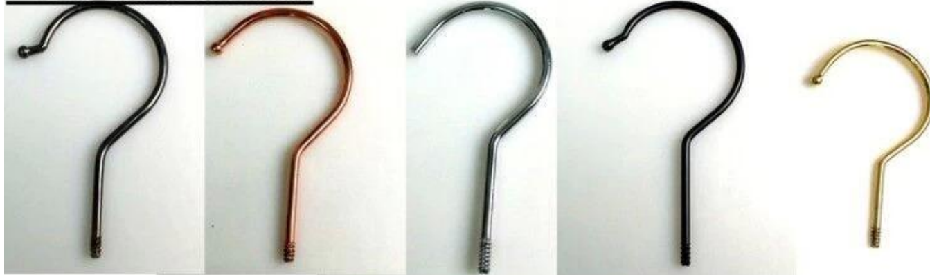
Dia: \varnothing 3.8mm gun black