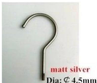
matt silver Dia: \varnothing 4.5mm