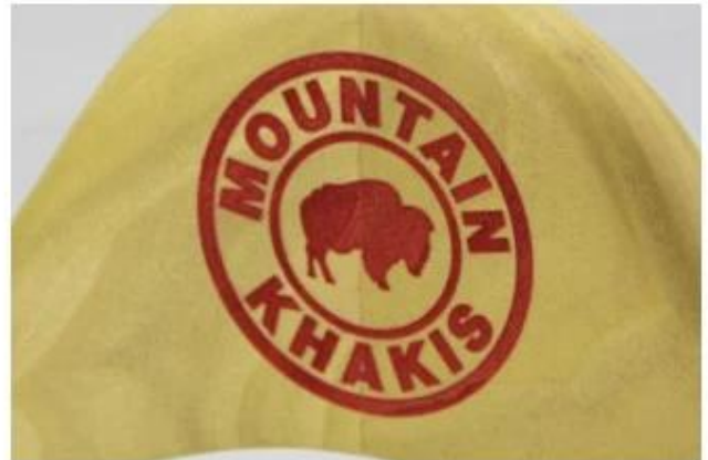
Laser logo in other color