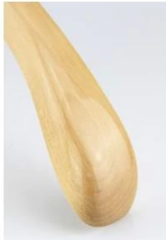
gloss natural wood color