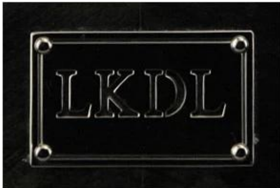
Metal plate logo