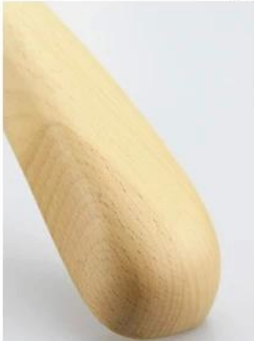
matte natural wood color