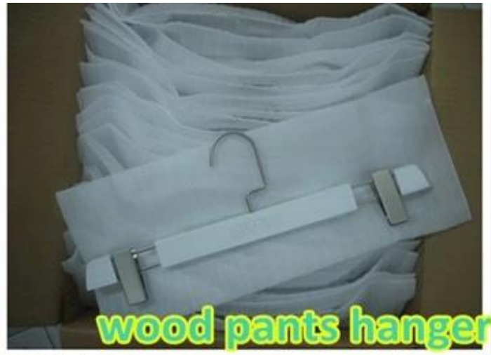
wood pants hanger