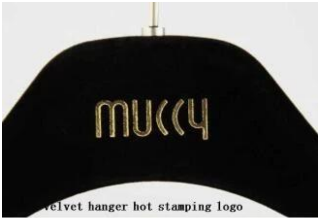
velvet hanger hot stamping logo