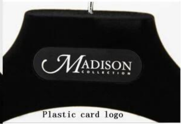
Plastic card logo