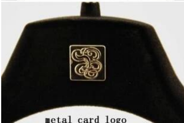
metal card logo