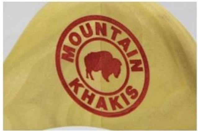
Laser logo in other color