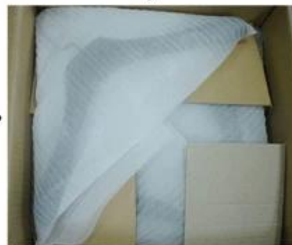
Place Layer by Layer