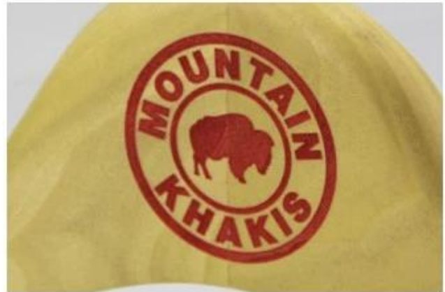
Laser logo in other color