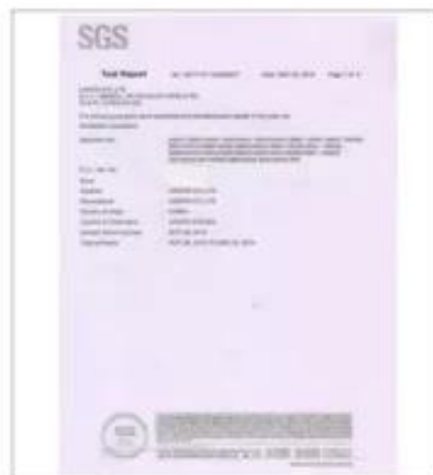
Product Test Report