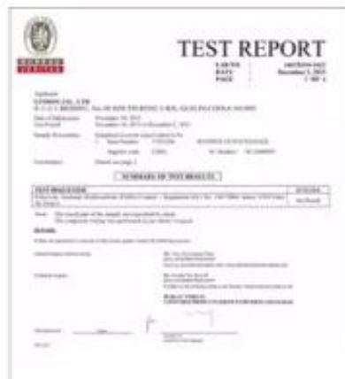
Product Test Report