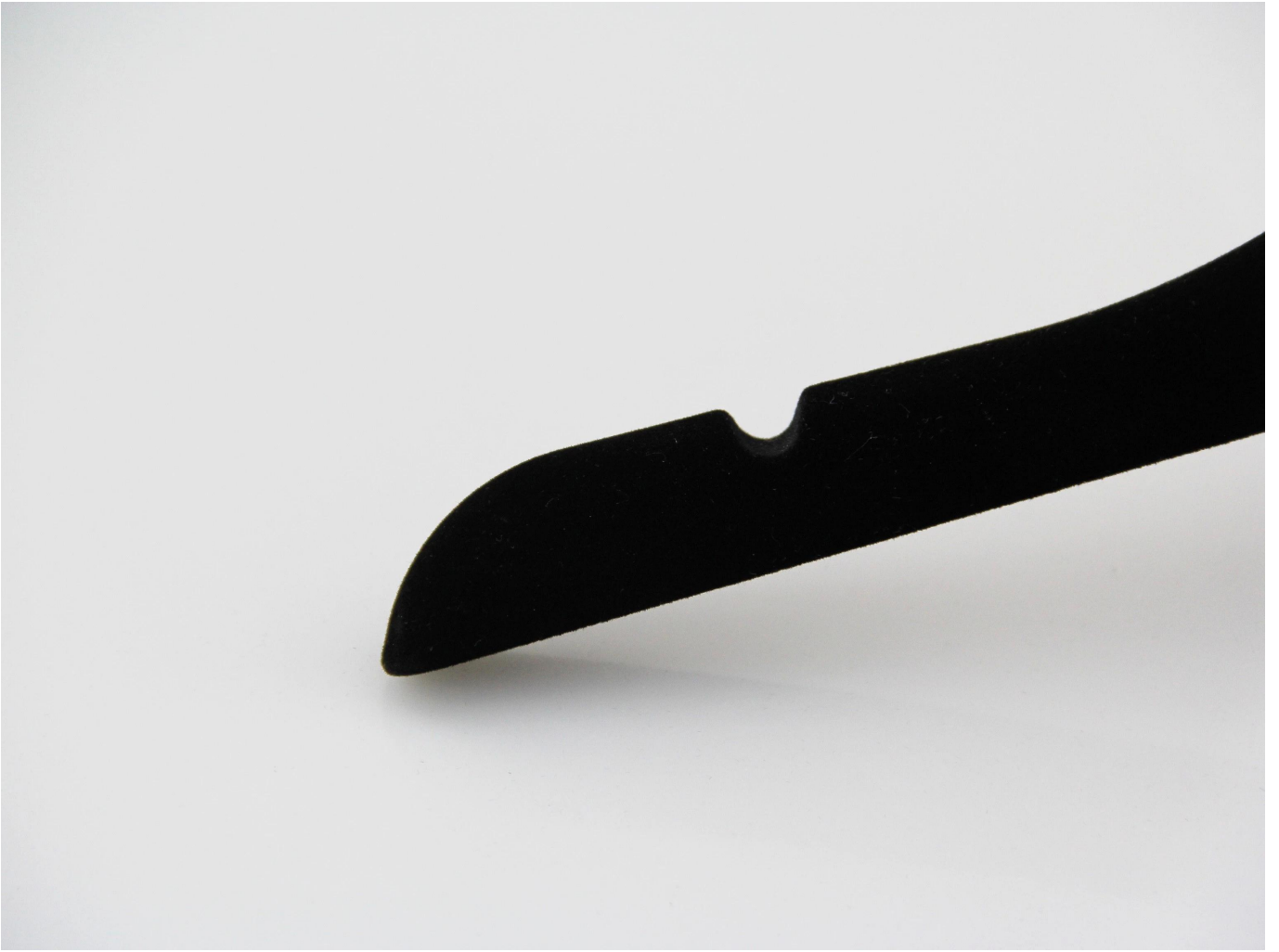
Accesorio de metal intercambiable