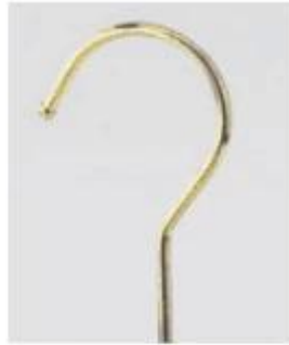
light gold with bulb