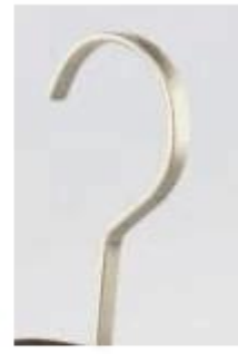
flat pearl nickel