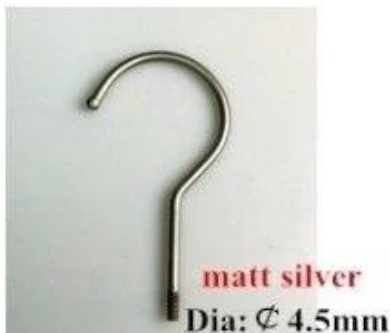
matt silver Dia: \varnothing 4.5mm