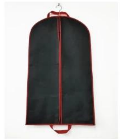
black suits bags