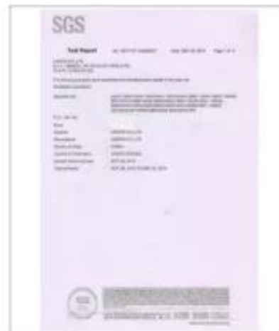
Product Test Report