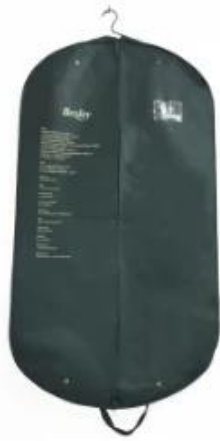
Green suits bags