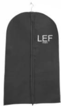
black suits bags