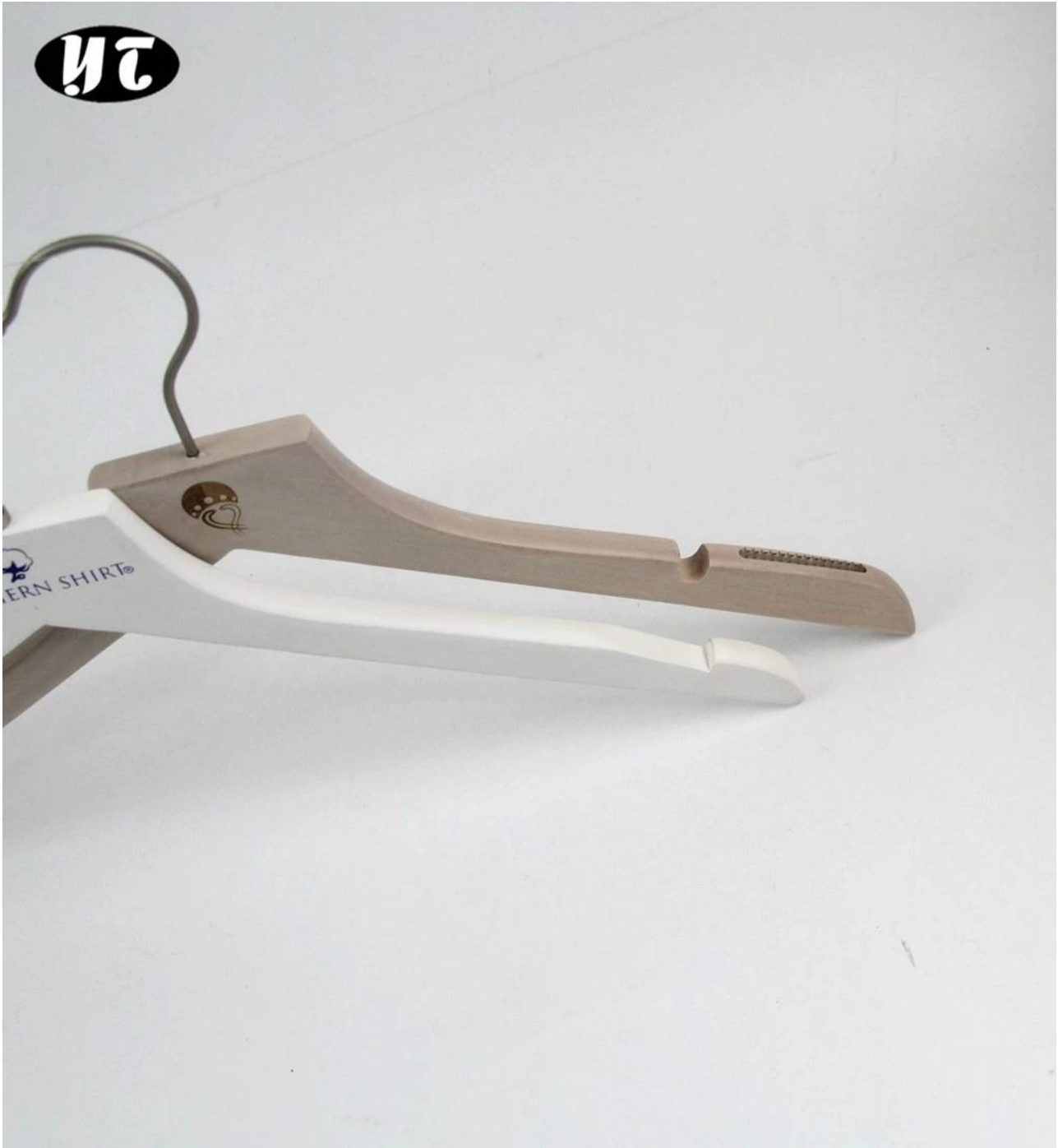
Cintre produire processus