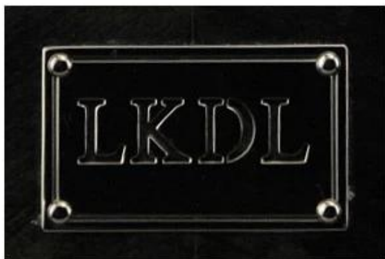
Metal plate logo