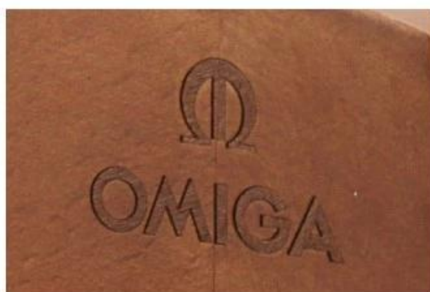
Laser logo before paint