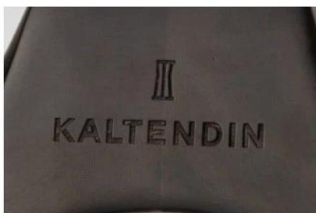
Laser logo before paint