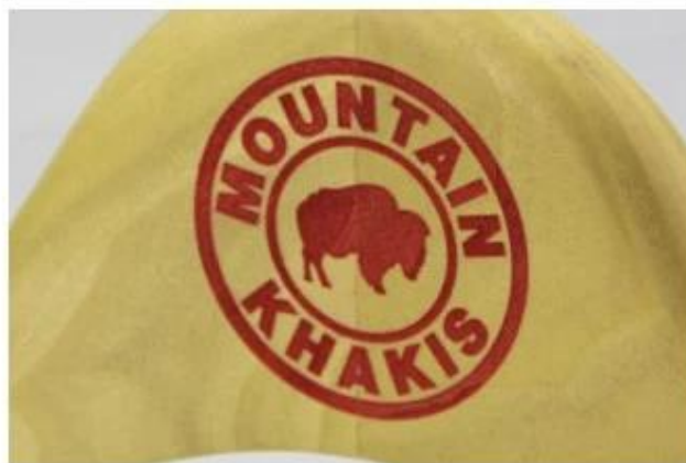
Laser logo in other color