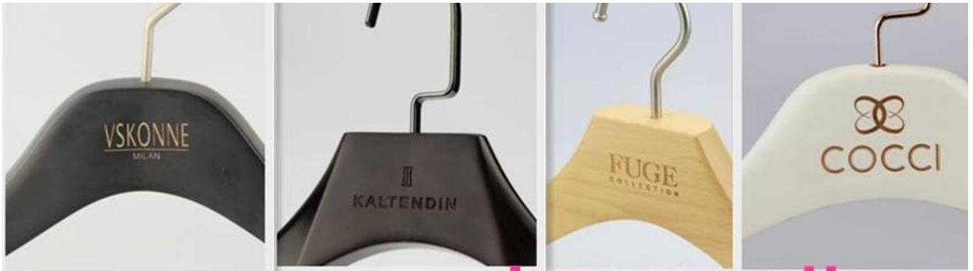
laser engraved logo