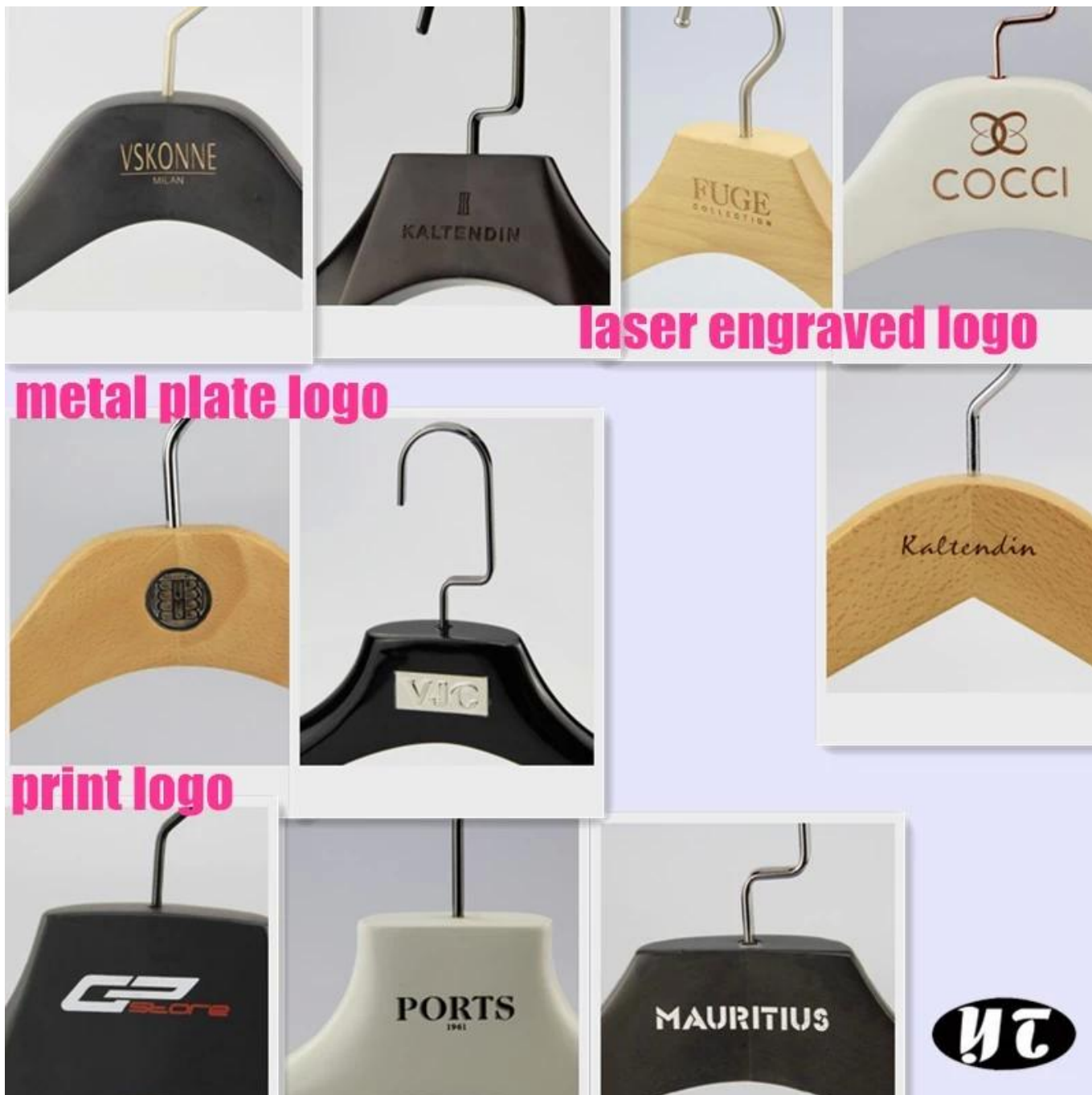
laser engraved logo