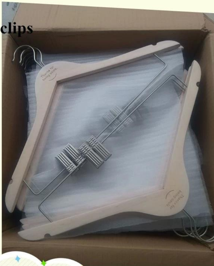
flat wooden hanger with clips package