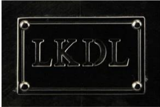
Metal plate logo