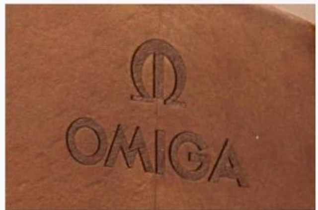
Laser logo before paint