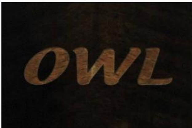
Laser logo after paint