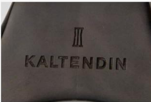
Laser logo before paint