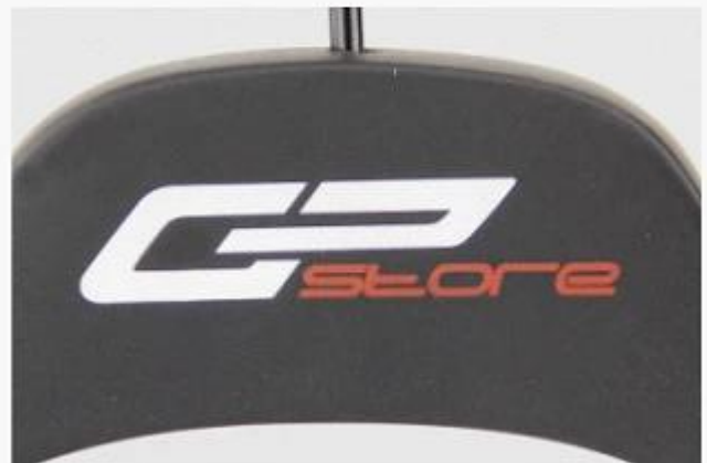
Silk-screen print logo