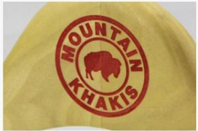
Laser logo in other color