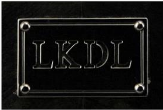
Metal plate logo