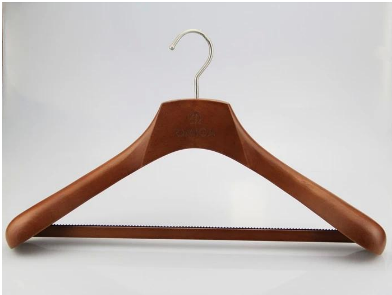
Affichage du logo