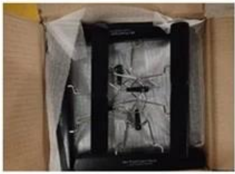
extension hair hanger