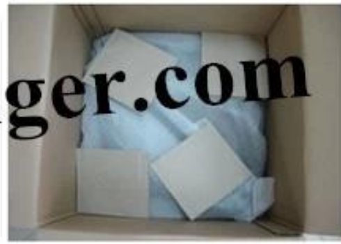
wooden hanger package