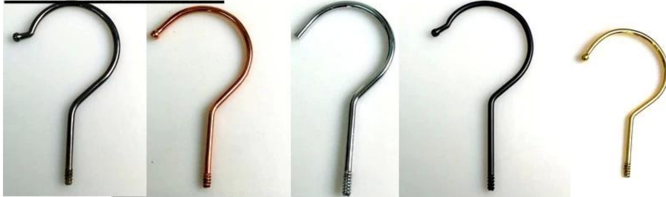
Dia: \varnothing 3.8mm gun black