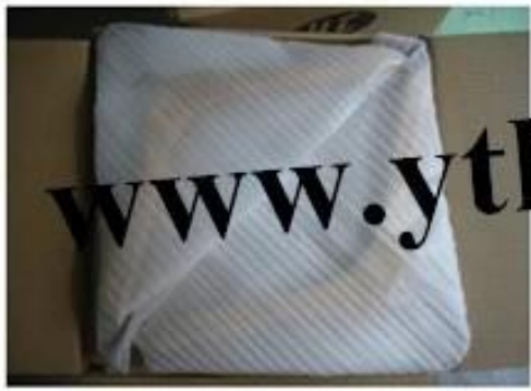
wooden hanger package