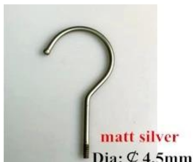
matt silver Dia: \varnothing 4.5mm