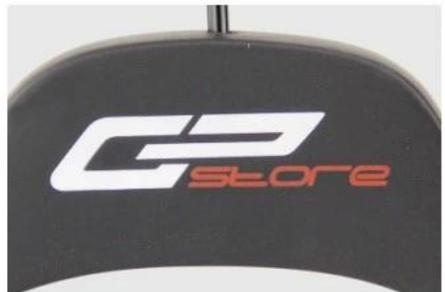
Silk-screen print logo

Logo d'impression sérigraphie: l'effet de logo plus réguliers et moins cher pour le cintre bois, vous pouvez nous offrir thePantone CU numéro de carte de couleur, nous ajuster la couleur d'encre selon elle. Et même peut faire deux couleurs et trois couleurs impriment le logo.