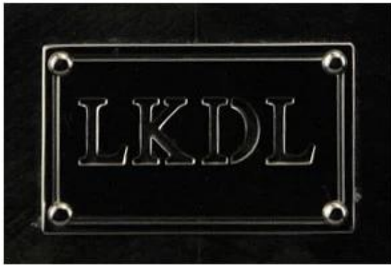
Metal plate logo