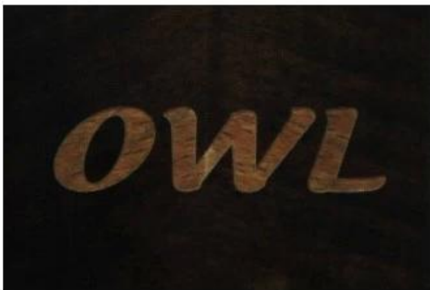
Laser logo after paint