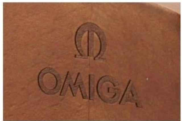
Laser logo before paint