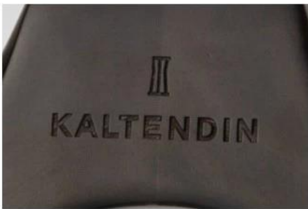
Laser logo before paint