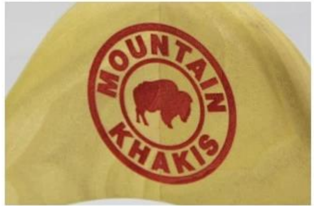
Laser logo in other color