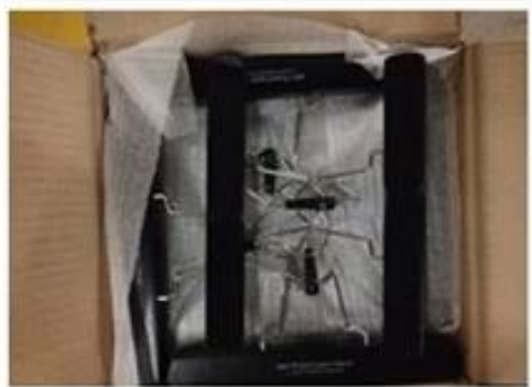
extension hair hanger