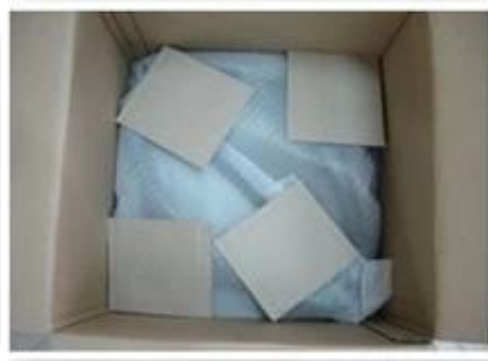
wooden hanger package