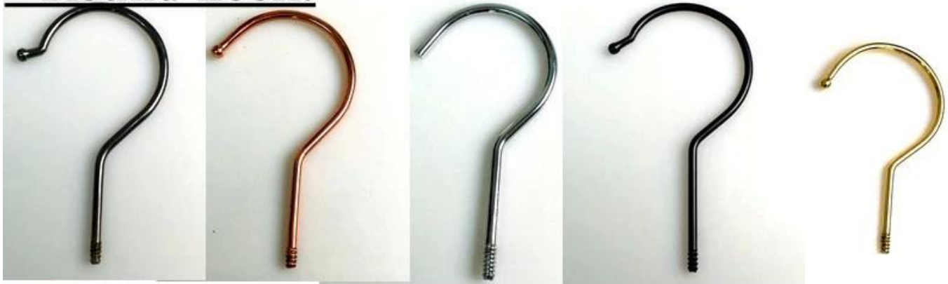
Dia: \varnothing 3.8mm gun black