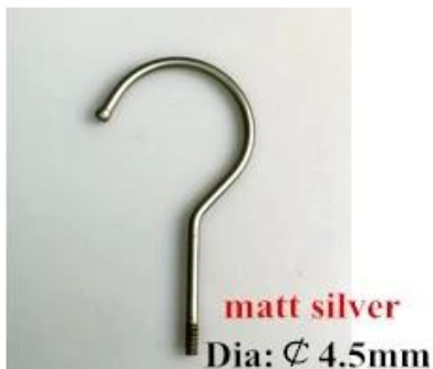
matt silver Dia: \varnothing 4.5mm