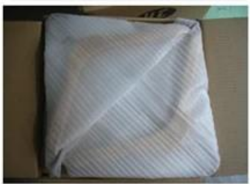
wooden hanger package