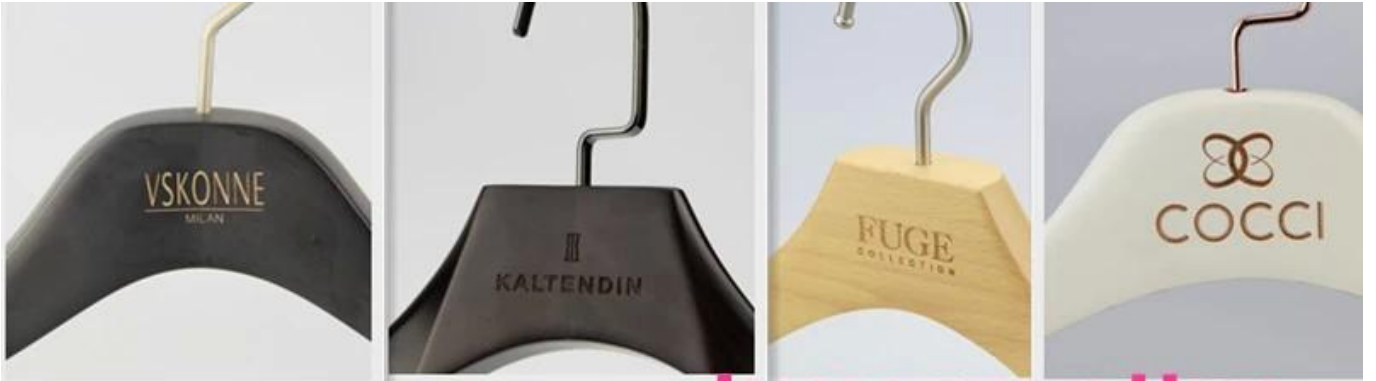
laser engraved logo