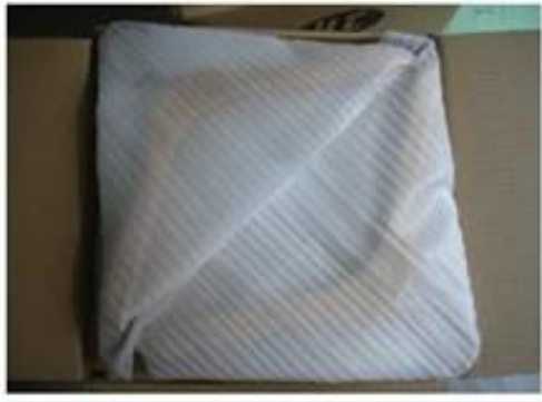
wooden hanger package