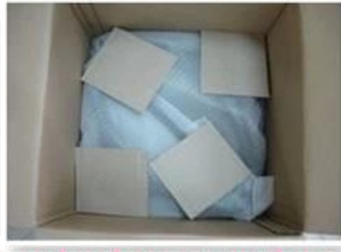
wooden hanger package