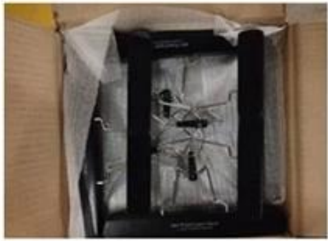
extension hair hanger