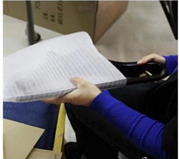
1pc Hanger with 1pc Bag