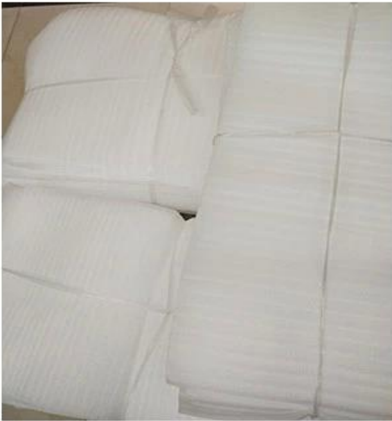
PE Foam Bag