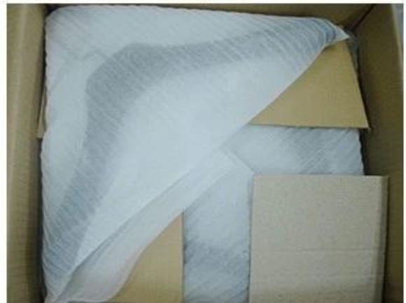
Place Layer by Layer