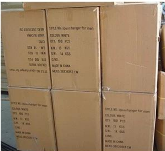
K=K Carton with Shipping Mark