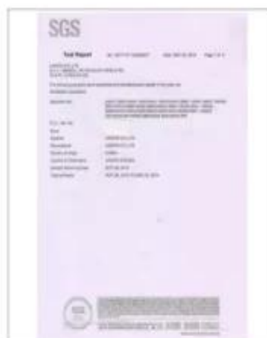
Product Test Report