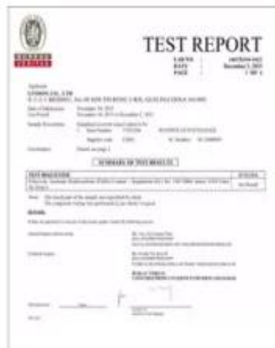
Product Test Report