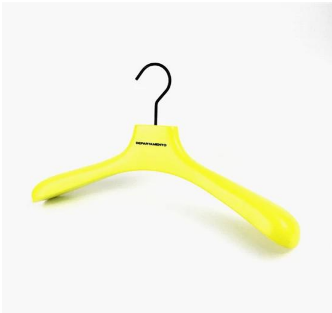
ACÚMEROS DE CADEIA