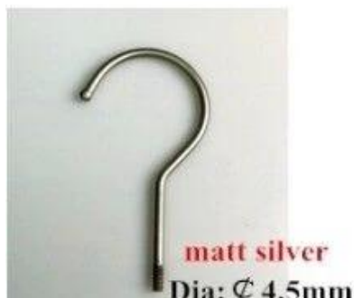
matt silver Dia: \varnothing 4.5mm