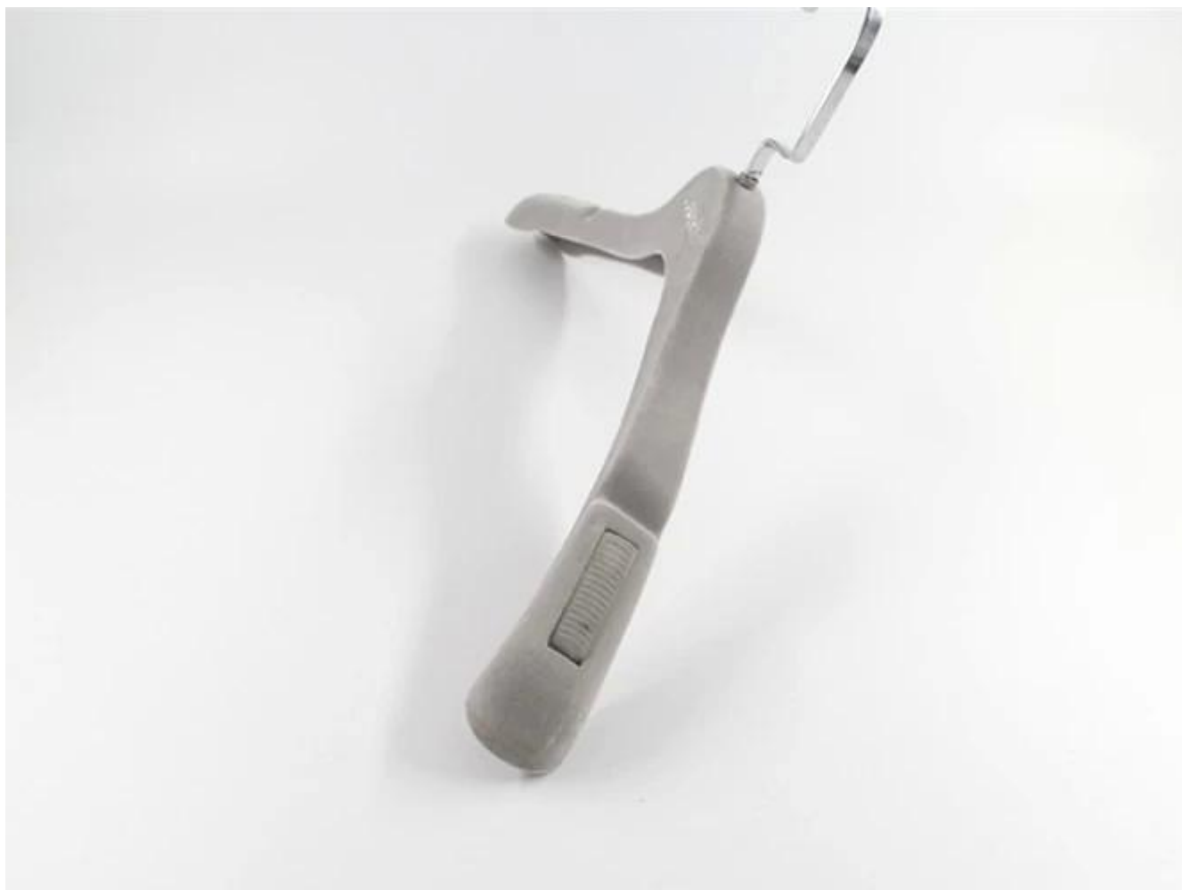
Acessório de metal mutável