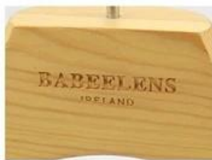
engrave logo(no painting)