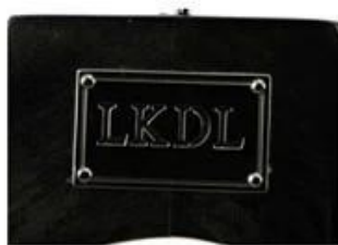
metal plate logo