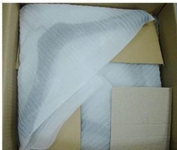
Place Layer by Layer