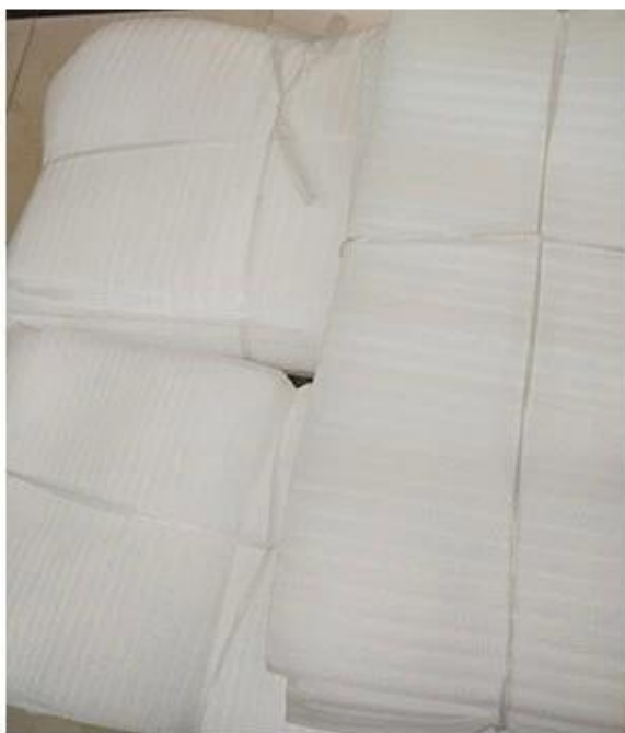
PE Foam Bag