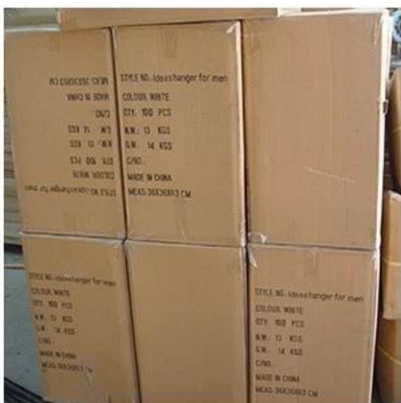
K=K Carton with Shipping Mark