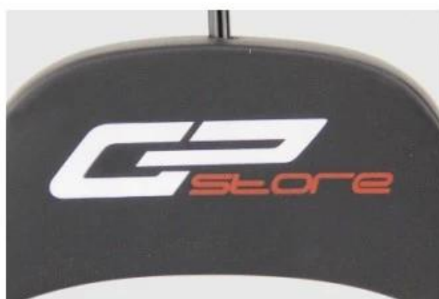
Silk-screen print logo

Печать логотипа трафаретная печать: эффект более гладкого и более дешевого логотипа для деревянного крючка, вы можете предложить нам номер карты цвета Pantone CU, у нас есть обычные цветные чернила в соответствии с ним. А также может сделать два цвета и три цвета печати логотипа.