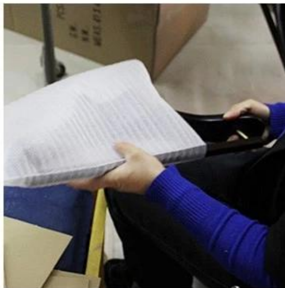
1pc Hanger with 1pc Bag