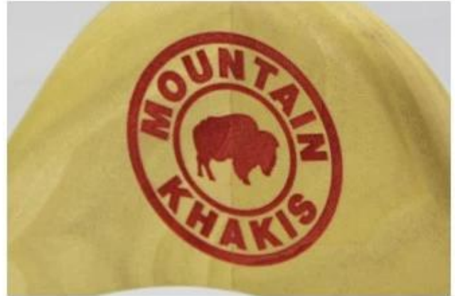
Laser logo in other color